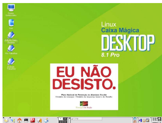
Figura 2 - Desktop Caixa Mágica / Salas TIC.

A montagem não é, no entanto, feita da mesma maneira que no Windows XP, ou seja, montar a área de modo a que o utilizador estivesse a trabalhar directamente na área no servidor.